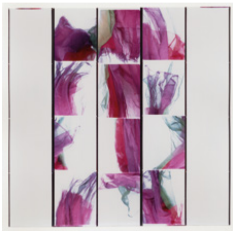
Ballet de Pantin Rire